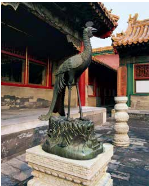
故宮体和殿前銅鳳