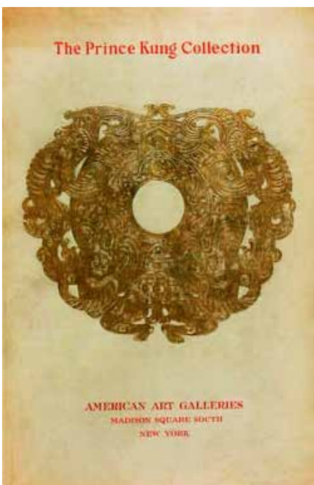
《恭亲王收藏专场拍卖中国珍贵文物》